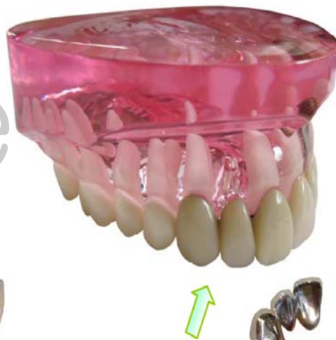
③保険ブリッジはこんな感じですよ♪