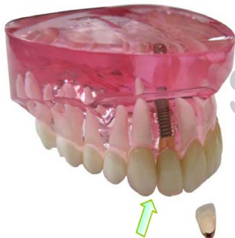
①インプラントはこんな感じですよ♪