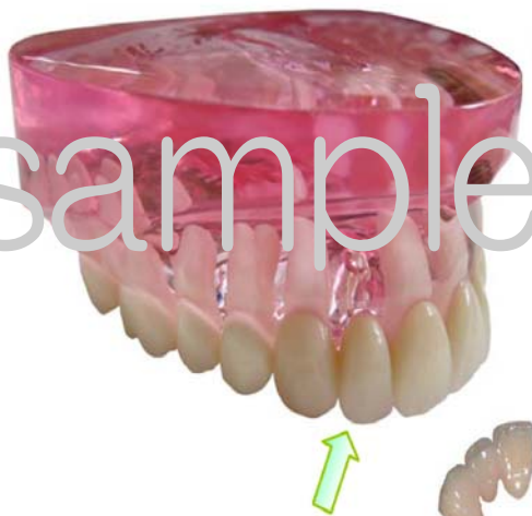
②自費ブリッジはこんな感じですよ♪