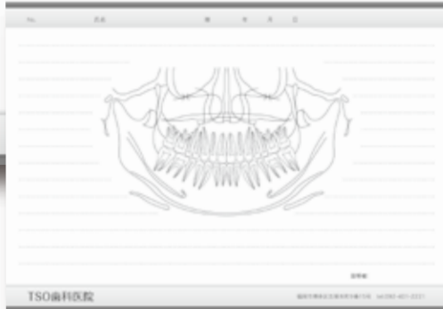
コミュニケーションシートII (A4・B5)