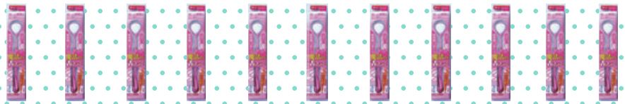
魔法の舌ブラシ (家庭用)